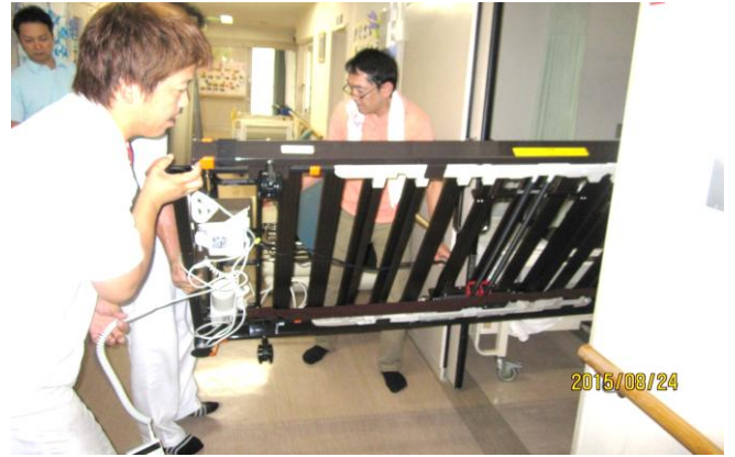
職員2名にて、抱えた状態にて 搬入を行う。