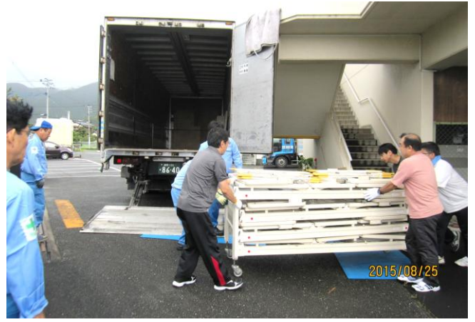
4tトラック (4セット 16台) 積み込み 10tトラック (8セット 32台) 積み込み 計:48台分輸送(博多港へ)