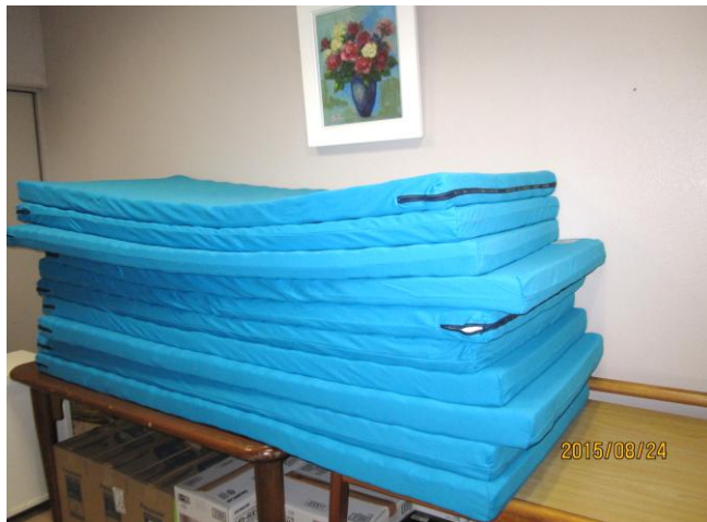
古いマットは、3階ホールにて保管 九州医療サービス(株)にて洗濯。