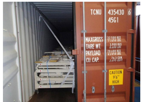
山九運送にて、ベッド本体をコンテナに 積み込み。