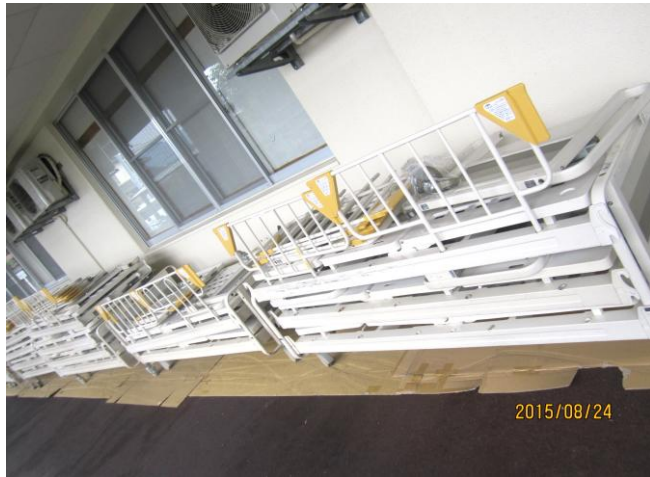
使用済みベッドは、コンテナに積み込む為、解体し、4台1セットにて準備する。