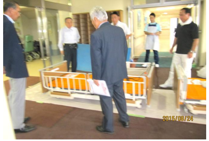
ベッド搬入及びラオス寄贈に関する説明及び打ち合わせ