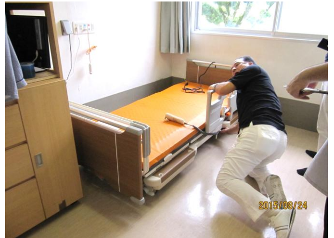
パラマウントベッドは幅90cmの為、居室入口より搬入可能。 <最終安全確認>