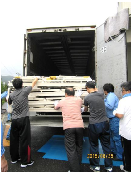
4t車は、リフト幅が狭く、ベッドのキャスター が脱輪する為、職員5名にて支えて入れる。