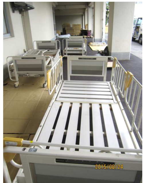
使用済みベッドを裏口へ並べる