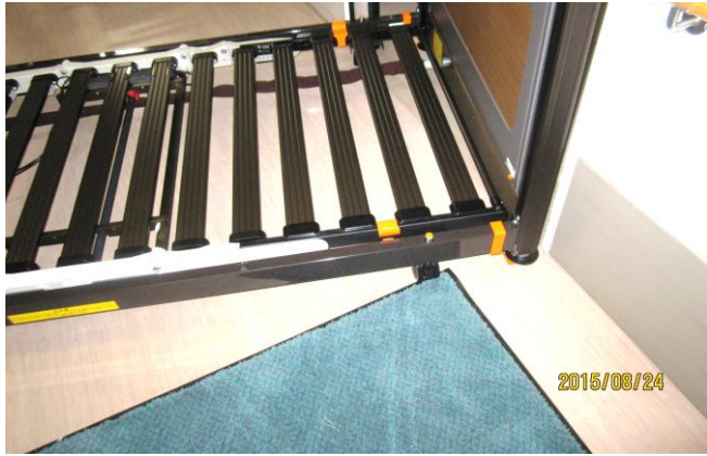
フランスベッドは幅が広い為、 通常の状態では、居室に入らず。