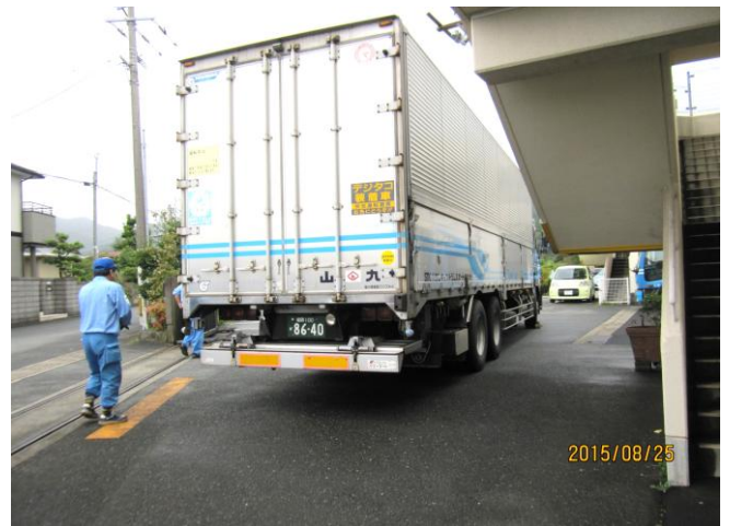
残りのベッドは10tトラックにて輸送