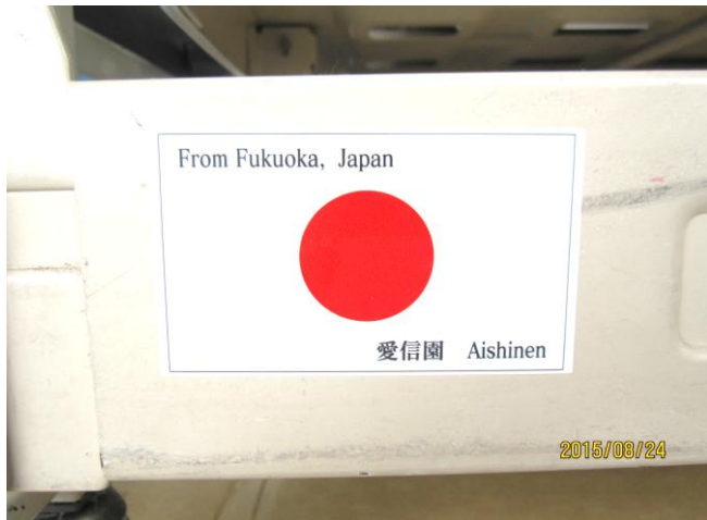
国旗シール480枚発注 寄贈ベッドの4隅に貼る。