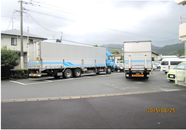
山九運送(代表者1名、運搬者2名) 台風の影響により、8時到着予定を 13時へ変更 (4t、10tトラック)