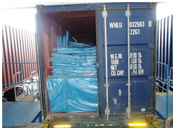
九州医療サービス(株)にて洗濯済のベッドマットを コンテナに積み込み。