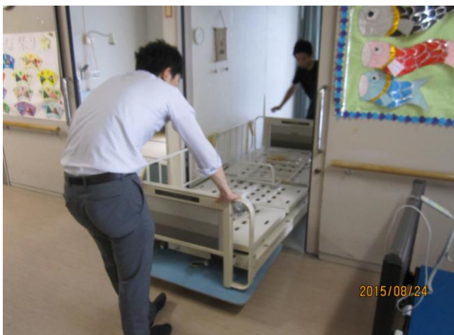
キャスターを外している使用済みベッドに ついては、台車の乗せて、搬出を行う。